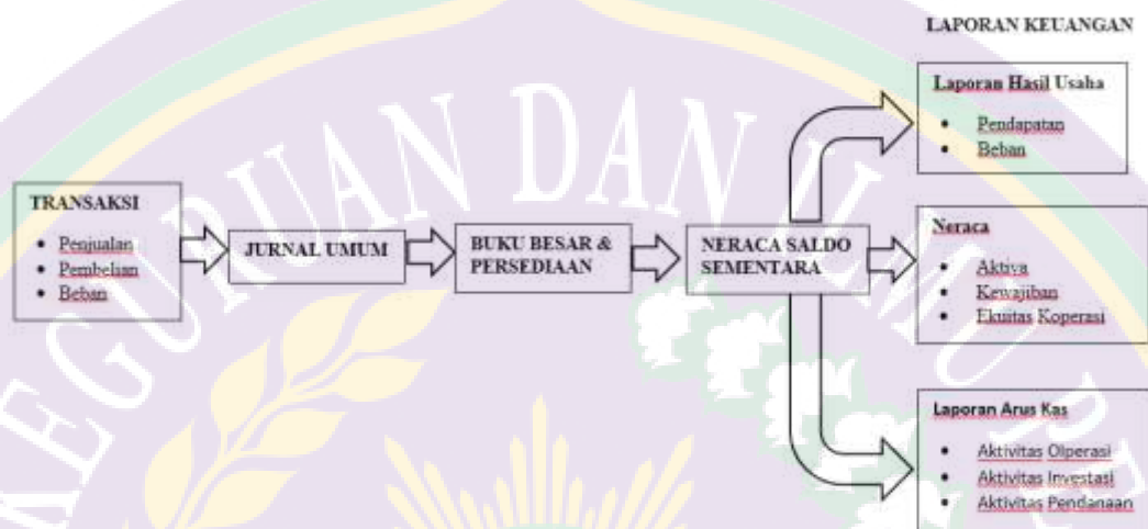
Gambar 1.2 Detail Siklus Akuntansi

adanya laporan keuangan, koperasi akan kesulitan menganalisis apa yang terjadi dalam koperasi dan bagaimana kondisi dan posisi koperasi pada periode tersebut. Secara detail, siklus akuntansi koperasi dapat dilihat pada gambar 1.2 dibawah ini.